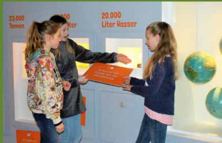
Partner unserer Bildungsprogramme ist die DEW21